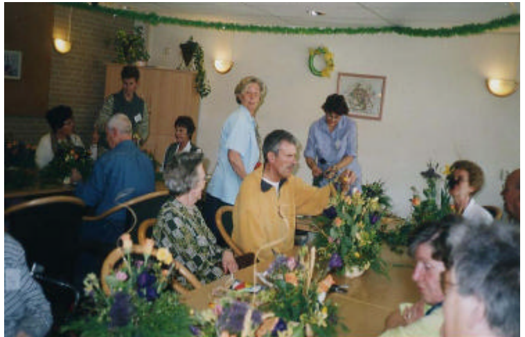
Crea-middag: bloemstukjes maken

Sinds het begin van het nieuwe jaar werd een bijdrage gevraagd voor het gebruik van de computer en de aanwezigheid per middag in de Com-in. Het was opvallend dat de mensen, die na de opening in november 2001 drie keer per week gebruik wilden maken van deze ruimte, na het invoeren van de bijdrage maar een keer per week kwamen.