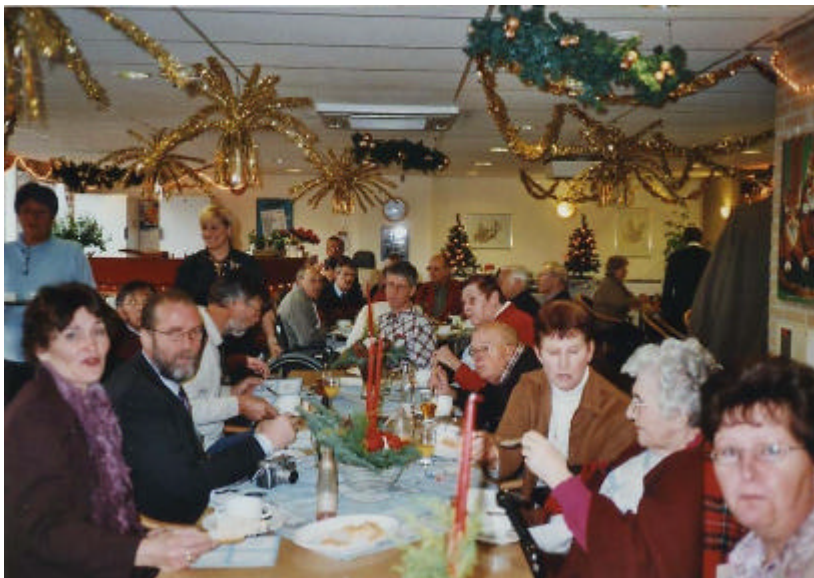
Kerstviering in Voornesteijn II

Het jaar 2003 is het lustrum jaar. Er bestaat een plan om een excursie te organiseren en een feestelijk bijeenkomst in de maand mei te realiseren.