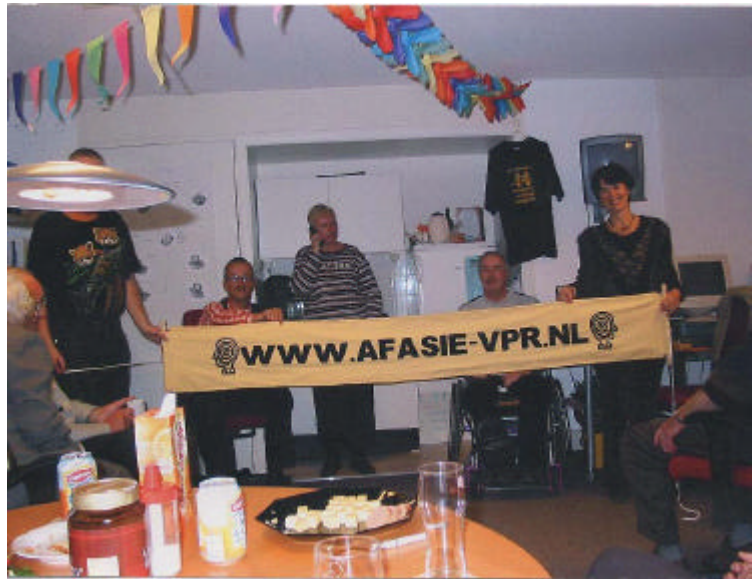
Viering 1 jaar Com-In. Spandoek gemaakt door vrijwilligers