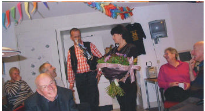
1 jarig bestaan van de Com-In